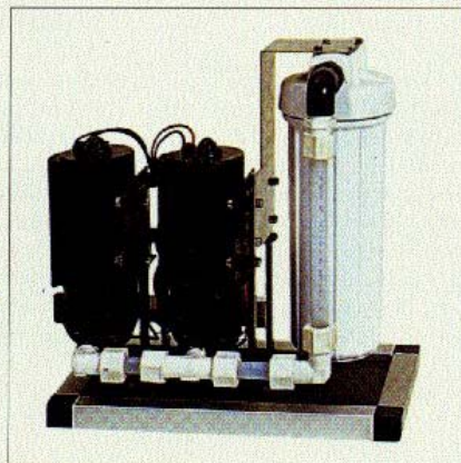
A destra, ecco come si presenta un'unità pompa a bassa pressione, i due contenitori cilindrici neri più il prefiltro, bianco, che ha il compito di bloccare le particelle più grandi in sospensione nell'acqua.

L'uscita dell'acqua dolce si connette al serbatoio posto più in alto, al fine di poter facilmente ripartire il carico con altri serbatoi posti più in basso. Quasi sempre si prevede anche una linea di connessione all'autoclave, che attraverso o una valvola manuale a 3 vie, o attraverso una elettrovalvola, devia l'aspirazione del dissalatore da acqua di mare ad acqua dolce per consentire il risciacquo dell'unità. I dissalatori sono in genere costituiti da 2 unità. Una pompa atta a prelevare l'acqua di mare e l'unità di dissalazione vera e propria. Al fine di ottimizzare il rendimento è consigliabile montare la pompa il più in basso possibile rispetto al livello del mare. Valide collocazioni del dissalatore sono vano motore, gavoni, sentine e vani. È consigliabile installare l'unità in una posizione tale da rendere la strumentazione e le eventuali valvole facilmente accessibili. I dissalatori di nuova generazione sono particolarmente silenziosi. In questo caso è quindi possibile installarlo anche in zone della barca non coibentate acusticamente, come dinette e cabine.