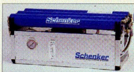
Sopra, ecco lo schema di come funziona un dissalatore di ultima generazione. A sinistra, un dissalatore prodotto dalla Schenker.

caso è meglio orientarsi verso un sistema a 220 V, alimentato dal gruppo elettrogeno (un consumo di 1,2 kW è troppo impegnativo per le batterie di servizio) e per un sistema di nuova generazione è più vantaggioso orientarsi sulle batterie.